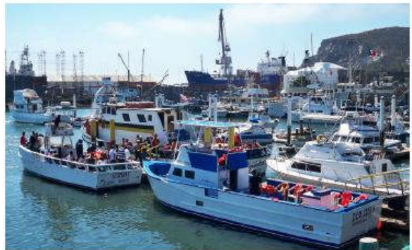
Tàu du ngoạn Vịnh Ensenada