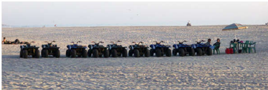
Trải nghiệm cảm giác mạnh khi lái xe Adventure (AV) trên bãi biển