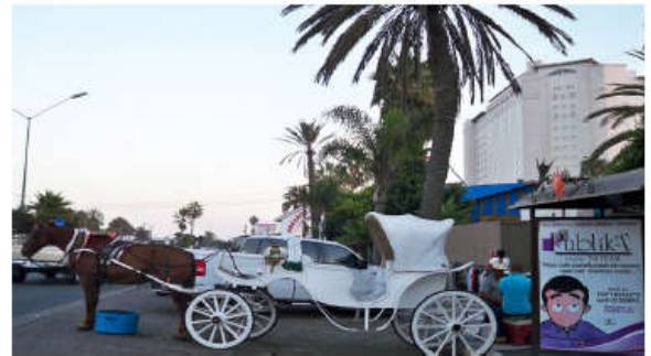
Xe ngựa dành cho cặp tình nhân và gia đình