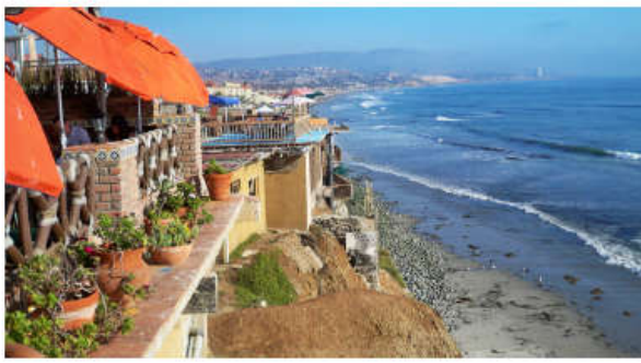
Đoàn ăn Tôm Hùm tại nhà hàng sát biển rất thơ mộng và lãng mạn