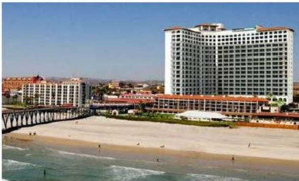
Khu du lịch Resort tại Rosarito