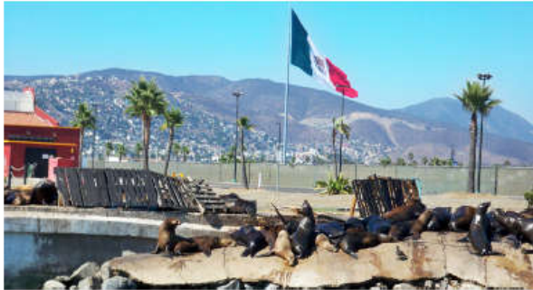
Ngắm nhìn các chú Hải cẩu trên Vịnh Ensenada