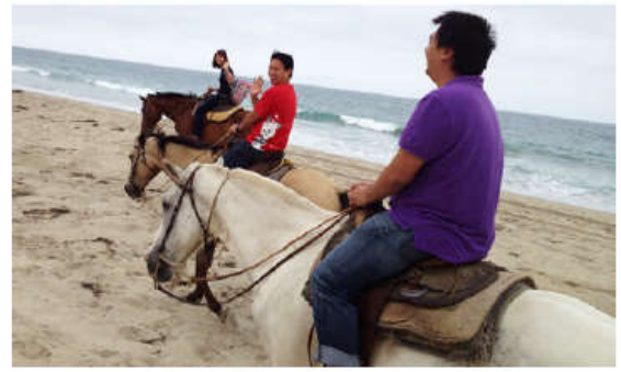
Trải nghiệm cưỡi ngựa trên bãi biển tuyệt đẹp