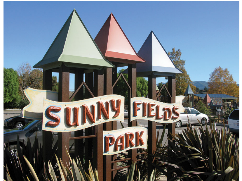
CÔNG VIÊN SUNNY FIELDS, SOLVANG