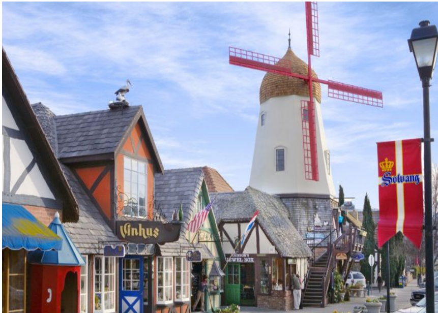
LÀNG ĐÀN MẠCH SOLVANG