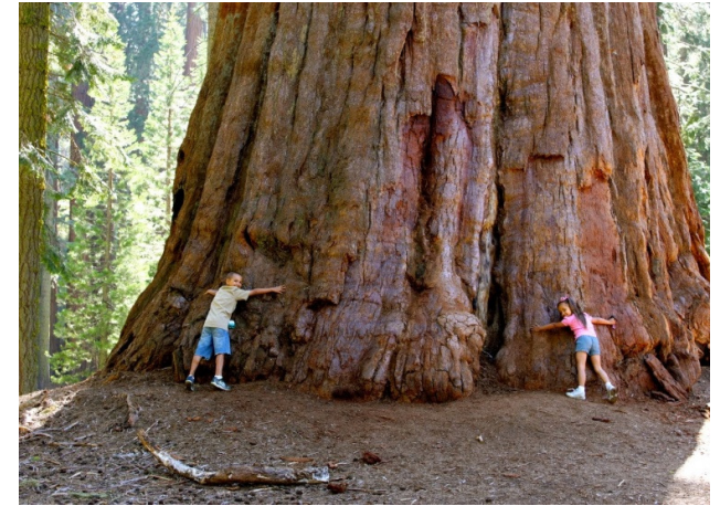
CHIỀU CAO 83M, ĐƯỜNG KÍNH 11M