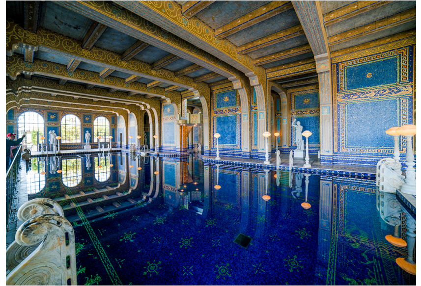
LÂU ĐÀI NỔI TIẾNG HEARST CASTLE