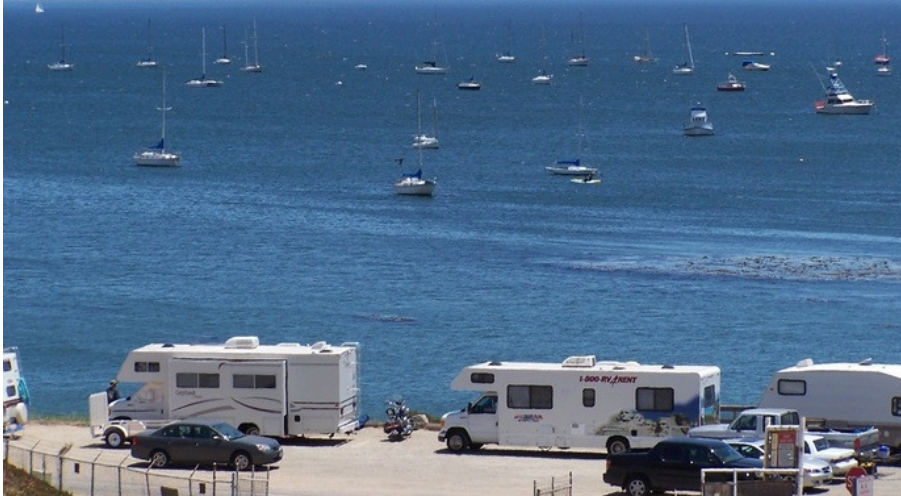
THÀNH PHỐ BIỂN ST LUIS OBISPO