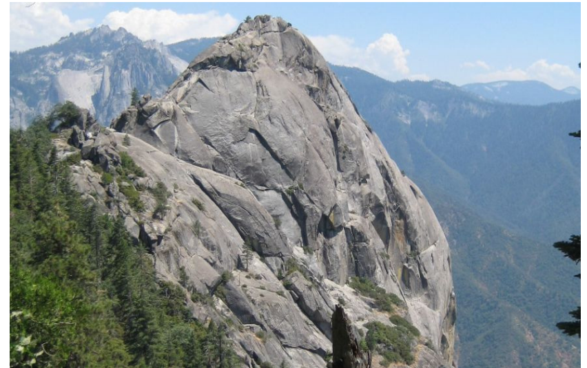
CÔNG VIÊN QUỐC GIA - SEQUOIA NATIONAL PARK