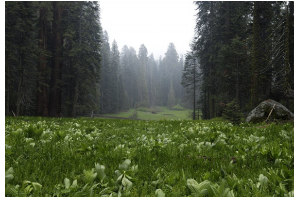
CÔNG VIÊN QUỐC GIA - SEQUOIA NATIONAL PARK