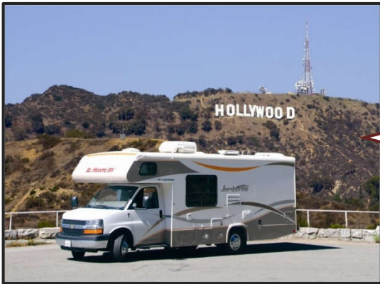
RV (Recreational Vehicle)

XU HƯỚNG DU LỊCH RV * Thường ngoạn cảnh Thiên nhiên & Sinh thái * Du lịch cùng gia đình, bạn * Tự lái xe RV tại Hoa Kỳ